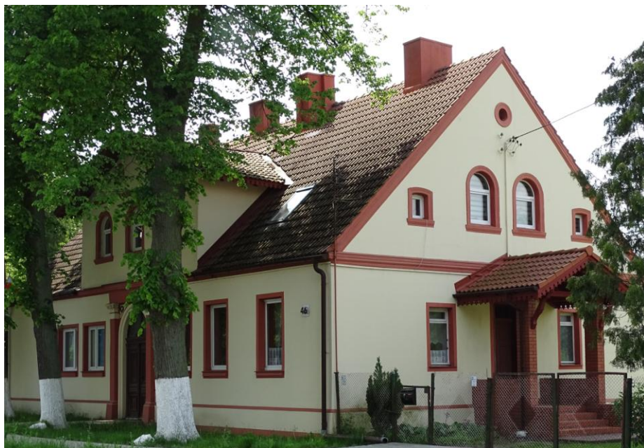
Widok ogólny od pñ.-wschodu

8. Fotografia z opisem wskazującym orientację albo mapa z zaznaczonym stanowiskiem archeologicznym