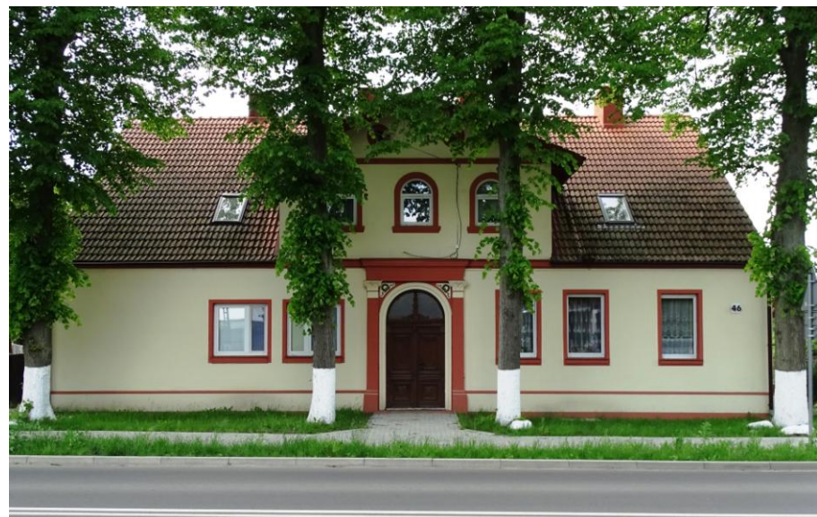
Elewacja frontowa - wschodnia

Okazały dom mieszkalny, o oryginalnej formie architektonicznej i wystroju (z elementami detalu), po remoncie. Budynek założony na planie prostokąta parterowy, częściowo podpiwniczony, nakryty wysokim dachem dwuspadowym (z szeroką wystawą frontową) i mieszkalnym poddaszem. Ściany murowane z cegły ceramicznej, tynkowane i malowane. Elewacje zachowały pierwotną kompozycję, z elementami detalu (profilowane gzymsy i opaski otworowe). Fasada 5-siowa, symetryczna, akcentowana 3-osiową wystawą oraz portalem drzwiowym w formie korynckich pilastrów z belkowaniem i dekoracją o motywach roślinnych. Zachowane oryginalne drzwi dwuskrzydłowe, płycinowe z naświetlem i dekoracją snycerską. Stolarka współczesna, ale osadzona w pierwotnych otworach.