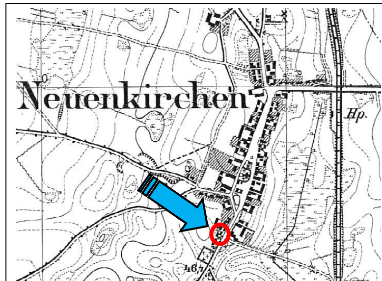
Dołuje: mapa sztabowa ( Messtischblatt ) - 1921