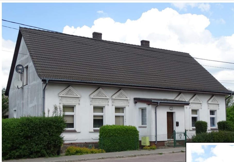
Widok ogólny od pld.-zachodu

8. Fotografia z opisem wskazującym orientację albo mapa z zaznaczonym stanowiskiem archeologicznym