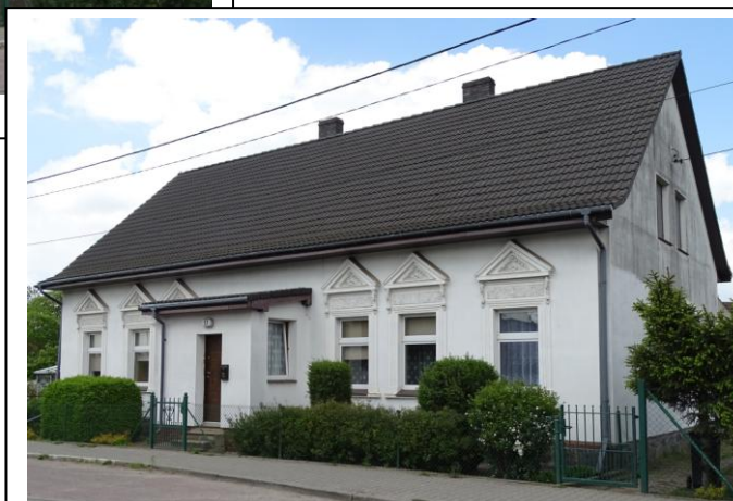
Widok ogólny od pld.-wschodu