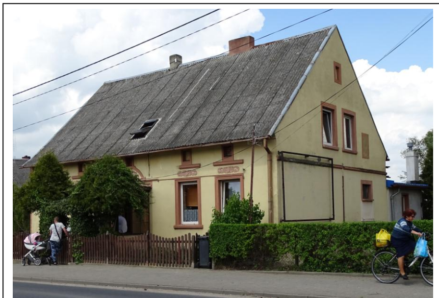
Widok ogólny od płd.-wschodu

Dom mieszkalny założony na planie prostokąta (z przybudówką w ścianie tylnej), parterowy, częściowo podpiwniczony, nakryty wysokim dachem dwuspadowym z mieszkalnym poddaszem podwyższonym o ściankę kolankową. Ściany murowane z cegły ceramicznej, tynkowane na gładko i malowane. Elewacje o pierwotnej kompozycji, z elementami detalu architektonicznego. Fasada 5-osiowa, symetryczna, akcentowana profilowanymi opaskami okiennymi i zwieńczonymi natynkową dekoracją o motywach roślinnych. Otwór drzwiowy ujęty szerokim obramieniem i zwieńczony półkolistym elementem z dekoracją roślinną.