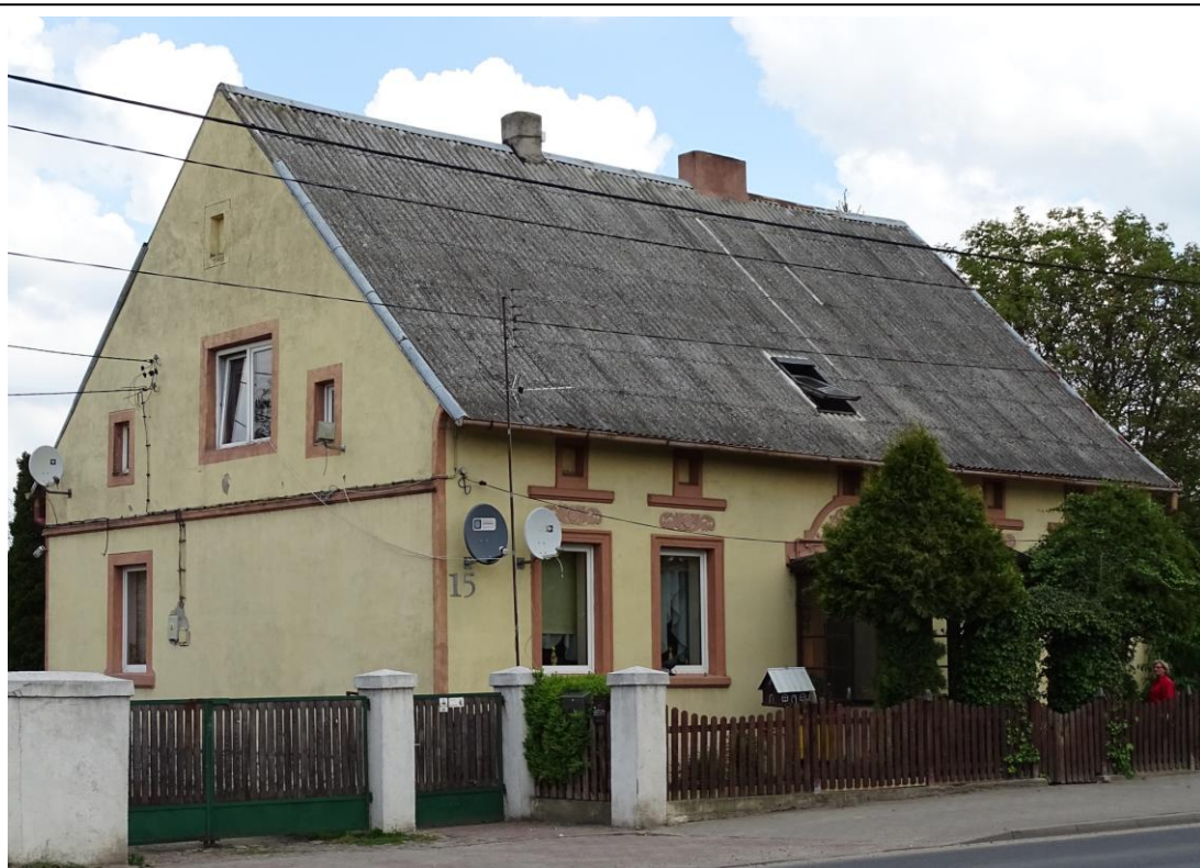
Widok ogólny od płd.-zachodu

8. Fotografia z opisem wskazującym orientację albo mapa z zaznaczonym stanowiskiem archeologicznym