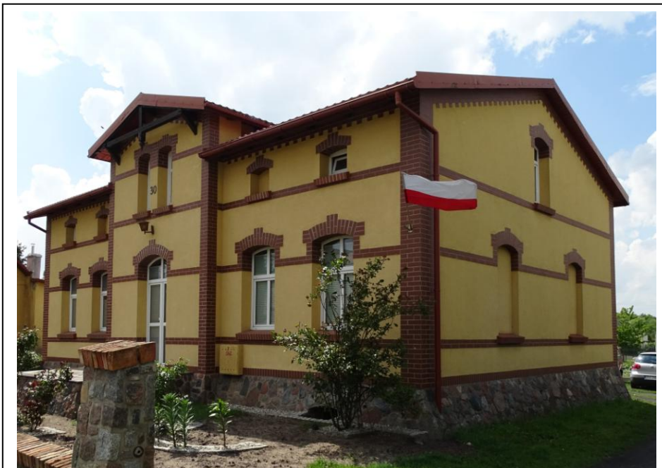
Widok ogólny od płn.-wschodu

Okazały dom mieszkalny, o oryginalnej formie architektonicznej i wystroju (z elementami detalu), po kompleksowym remoncie – rewaloryzacji. Budynek założony na planie prostokąta z frontowym ryzalitem pozornym, parterowy, nakryty płaskim dachem dwuspadowym z mieszkalnym poddaszem powiększonym o wysoką ściankę kolankową. Ściany murowane z cegły ceramicznej, wtórnie ocieplone, tynkowane i malowane. Elewacje zachowały pierwotną, symetryczną kompozycję, akcentowane odtworzonym detalem z płytek ceramicznych: narożne lizeny, gzymsy pasowe, odcinkowe (z klińcami) nadproża okienne. Stolarka współczesna, ale odwzorowująca pierwotne formy.