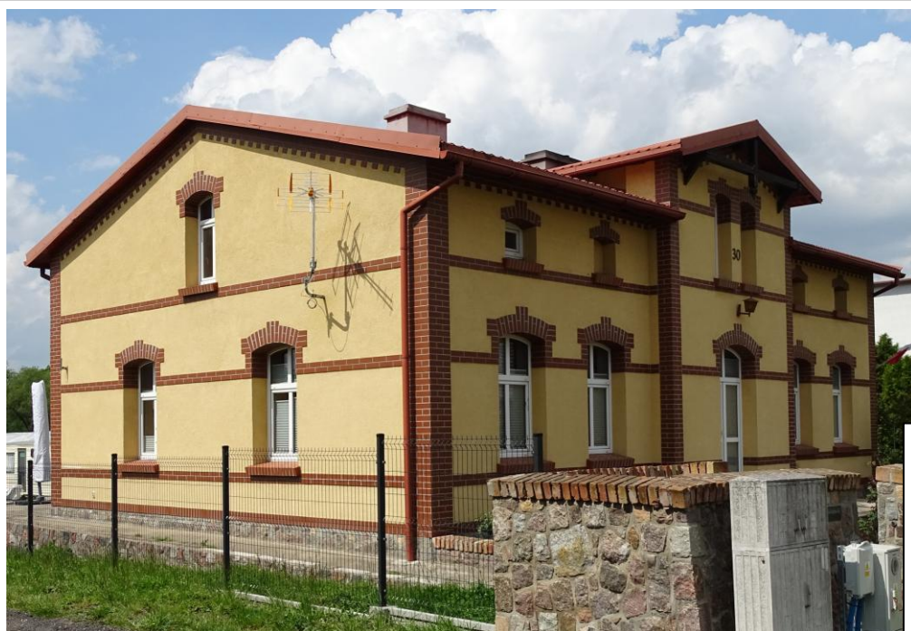
Widok ogólny od płd.-wschodu

8. Fotografia z opisem wskazującym orientację albo mapa z zaznaczonym stanowiskiem archeologicznym