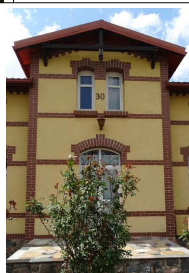
Ryzalit frontowy, detal