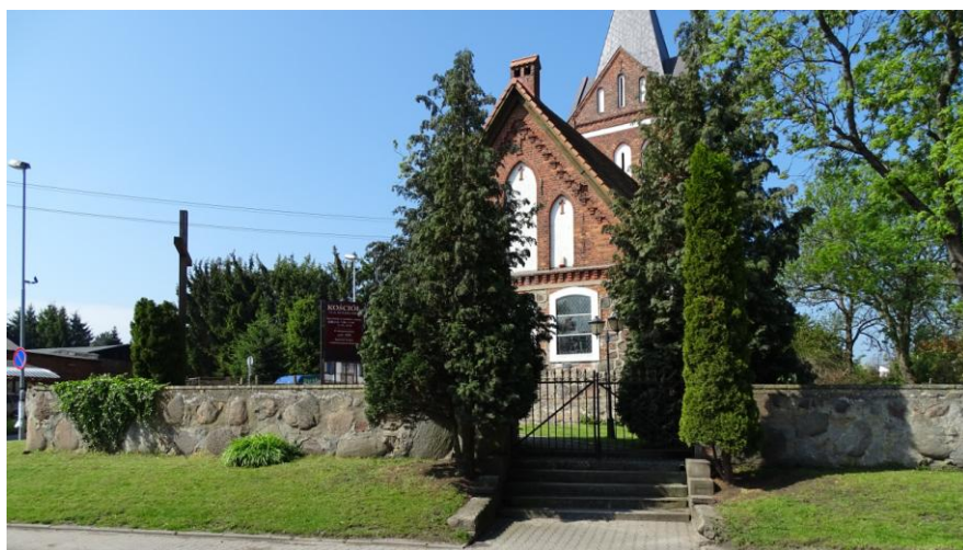
Widok ogólny od wschodu

8. Fotografia z opisem wskazującym orientację albo mapa z zaznaczonym stanowiskiem archeologicznym