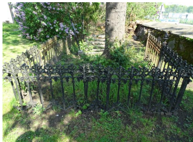
Żeliwne ogrodzenie kwatery rodzinnej