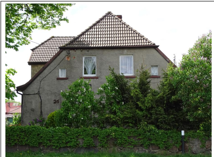
Elewacja szczytowa - wschodnia

Budynek założony na planie wydłużonego prostokąta, parterowy, nakryty wysokim dachem naczółkowym z frontową wystawą i mieszkalnym poddaszem. Ściany murowane z cegły ceramicznej, tynkowane i częściowo ocieplone. Fasada 5-osiowa, przekształcona, zaakcentowana dwukondygnacyjnym ryzalitem pozornym, zwieńczonym trapezowatym szczytem. Stolarka okienna i drzwiowa wtórna, w tym o ahistorycznych formach.