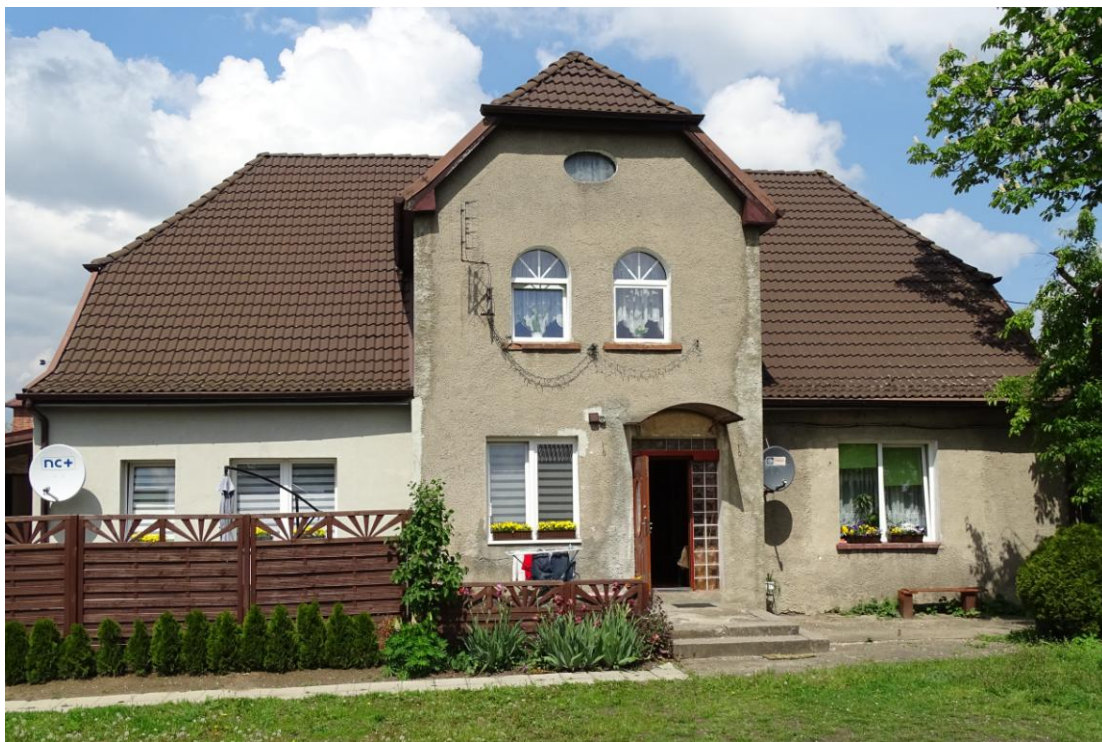
Elewacja frontowa - południowa

8. Fotografia z opisem wskazującym orientację albo mapa z zaznaczonym stanowiskiem archeologicznym