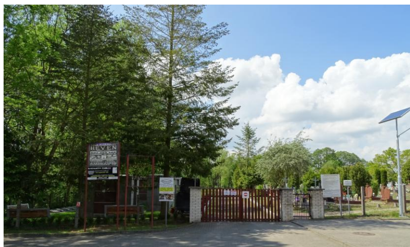
Widok ogólny od południa – brama wjazdowa

8. Fotografia z opisem wskazującym orientację albo mapa z zaznaczonym stanowiskiem archeologicznym