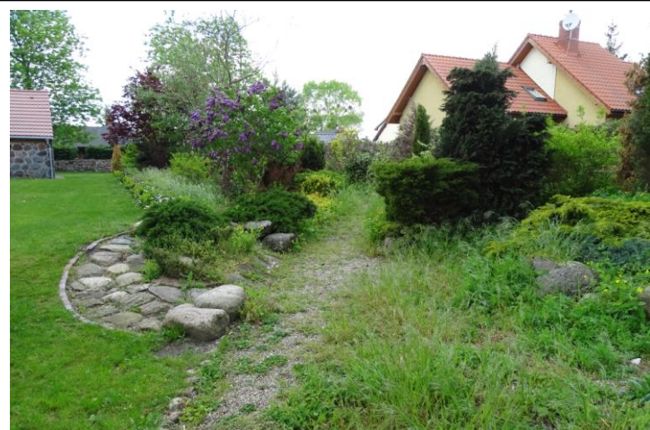
Północna część cmentarza