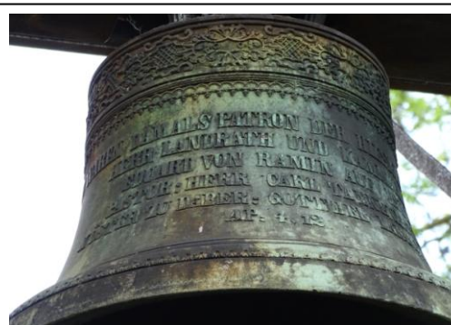
Dzwon z 1861 r.