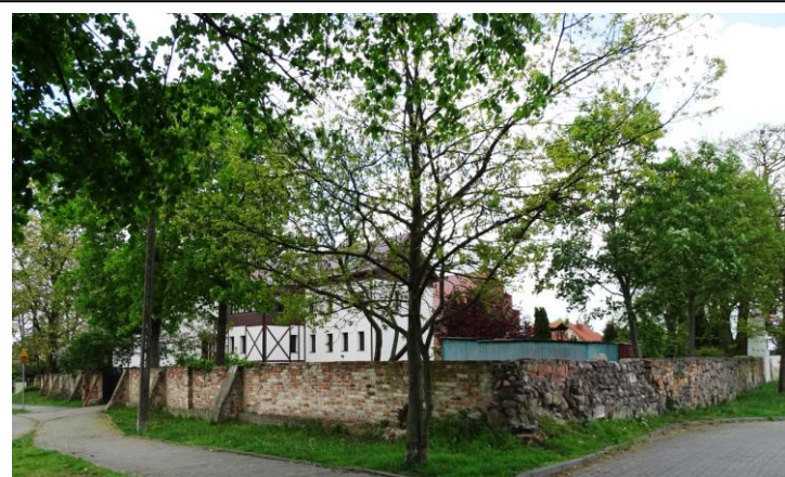
Widok ogólny od płd.-wschodu

8. Fotografia z opisem wskazującym orientację albo mapa z zaznaczonym stanowiskiem archeologicznym