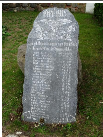
Kamienna tablica poległych w IWS