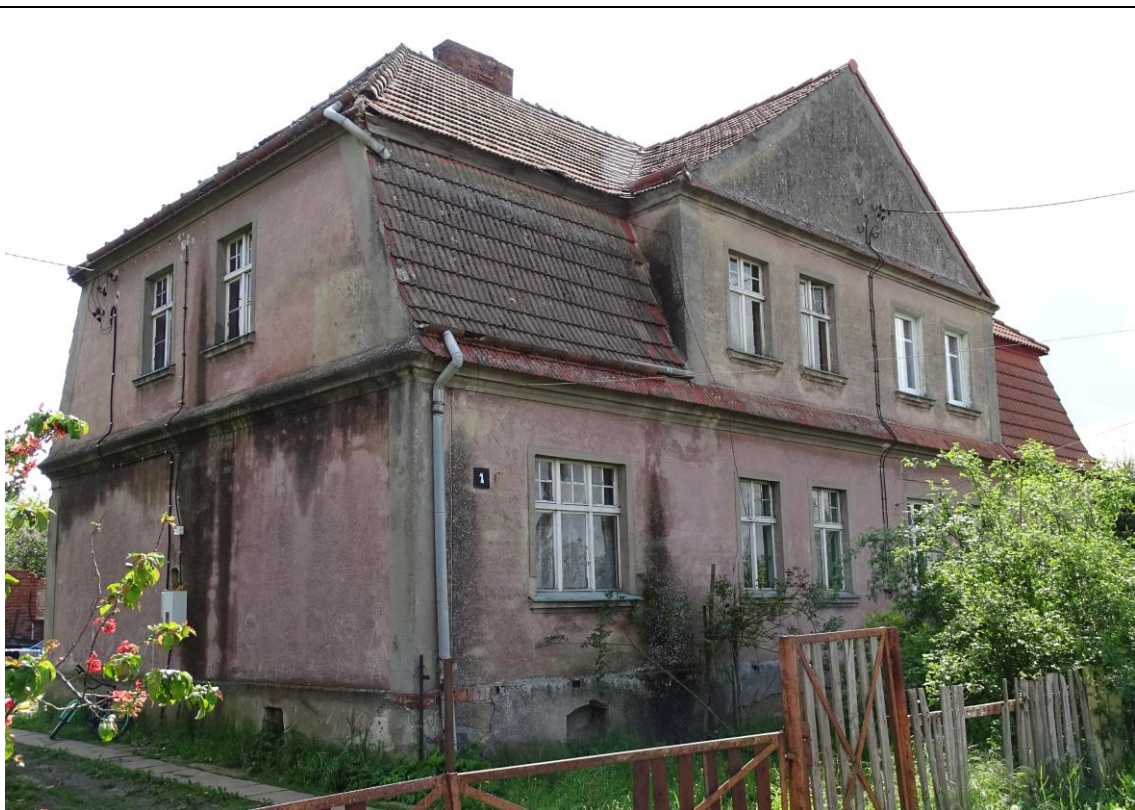
Widok ogólny od płn.-zachodu

8. Fotografia z opisem wskazującym orientację albo mapa z zaznaczonym stanowiskiem archeologicznym