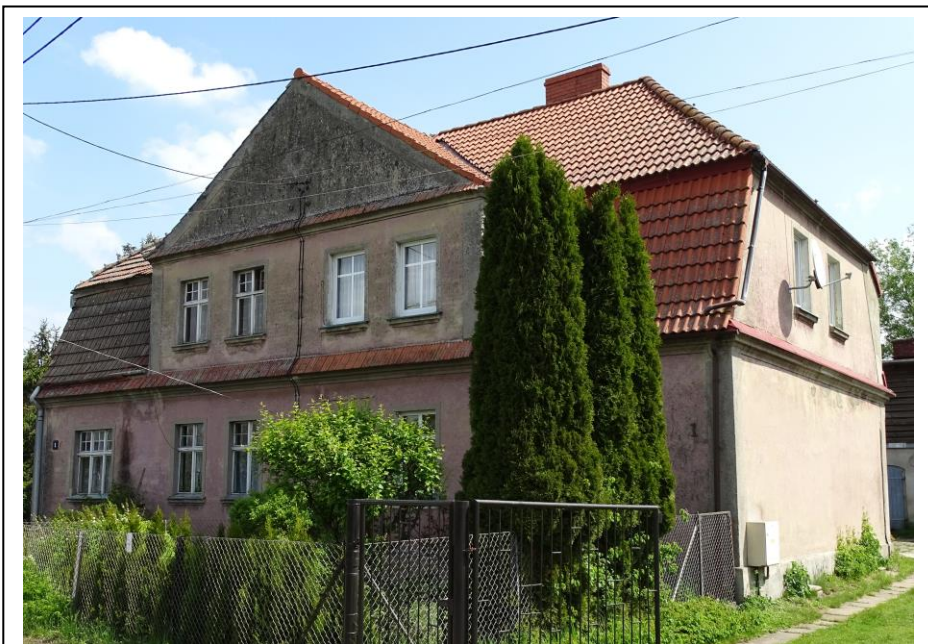
Widok ogólny od pld.-wzahodu

Okazały dom mieszkalny (obecnie kilkurodzinny), o oryginalnej formie architektonicznej i kompozycji elewacji. Budynek założony na planie prostokąta, parterowy, podpiwniczony, nakryty dachem mansardowym (pokrycie dachówkowe), z szeroką wystawą frontową. Ściany murowane z cegły ceramicznej, tynkowane. Elewacje o regularnej kompozycji, opięte narożnymi lizenami i zwieńczone profilowanymi gzymsami. Fasada 6-osiowa, symetryczna, zaakcentowana 4-osiową wystawą, zwieńczoną trójkątnym szczytem z rozetą w tynku. Częściowo zachowana oryginalna stolarka okienna (okna 4-skrzydłowe z podziałem szprosowym).