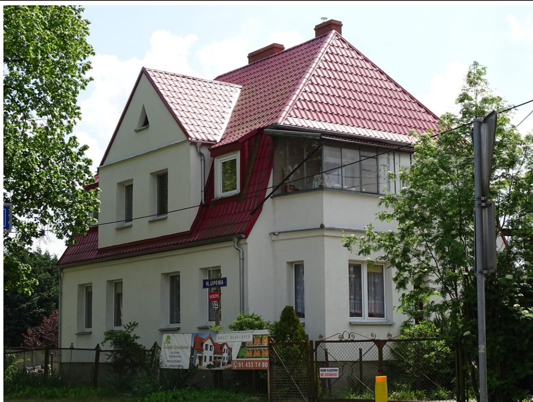
Widok ogólny od płn.-zachodu

8. Fotografia z opisem wskazującym orientację albo mapa z zaznaczonym stanowiskiem archeologicznym