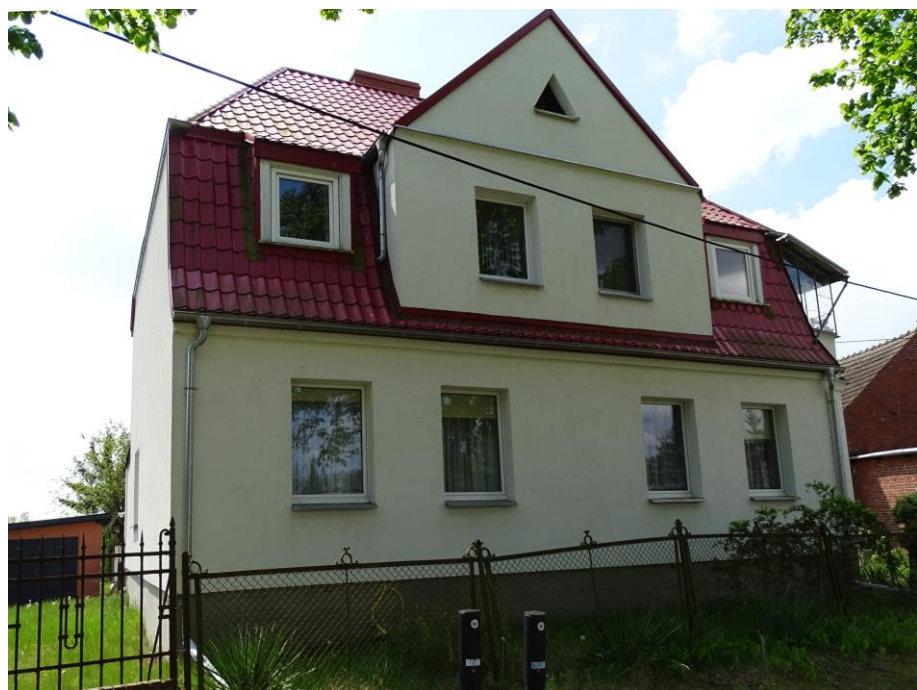
Widok ogólny od płn.-wschodu

Niewielki dom mieszkalny o oryginalnej formie architektonicznej i kompozycji elewacji – po remoncie. Budynek założony na planie prostokąta, parterowy (z gankiem i bakenem w szczycie), nakryty dachem mansardowym, z wystawą frontową i lukarnami. Ściany murowane z cegły ceramicznej, docieplone, tynkowane. Fasada 4-osiowa, symetryczna, zaakcentowana 2-osiową wystawą, zwieńczoną prostym gzymsem. Stolarka współczesna.