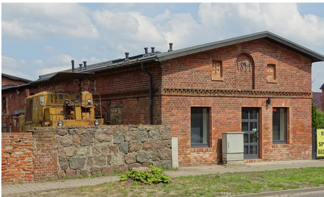
Widok ogólny od pld.-zachodu

8. Fotografia z opisem wskazującym orientację albo mapa z zaznaczonym stanowiskiem archeologicznym