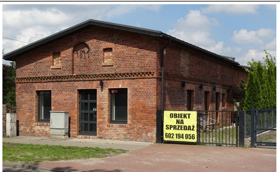
Widok ogólny od płd.-zachodu

Budynek gospodarczy w ramach dużej zagrody chłopskiej, o historycznej formie architektonicznej, z elementami detalu; obecnie użytkowany na cele handlowe. Budynek posadowiony szczytem do drogi, założony na planie prostokąta, parterowy, nakryty płaskim (asymetrycznym) dachem dwuspadowym, z poddaszem powiększonym o ściankę kolankową. Ściany murowane z cegły ceramicznej, nietynkowane. Elewacje dzielone gzymsami pilastymi i schodkowymi. Pośrodku szczytu południowego pełnołukowa blenda z datownikiem [1891].