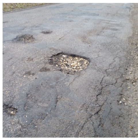
OGŁOSZENIE WŁASNE WYDAWCY

Starostwo Powiatowe w Policach zapowiedziało, że w marcu rozpoczną się prace budowlane na drodze powiatowej 3911Z. Dzięki inwestycji przebudowany zostanie odcinek o długości 1,65 km - od ronda