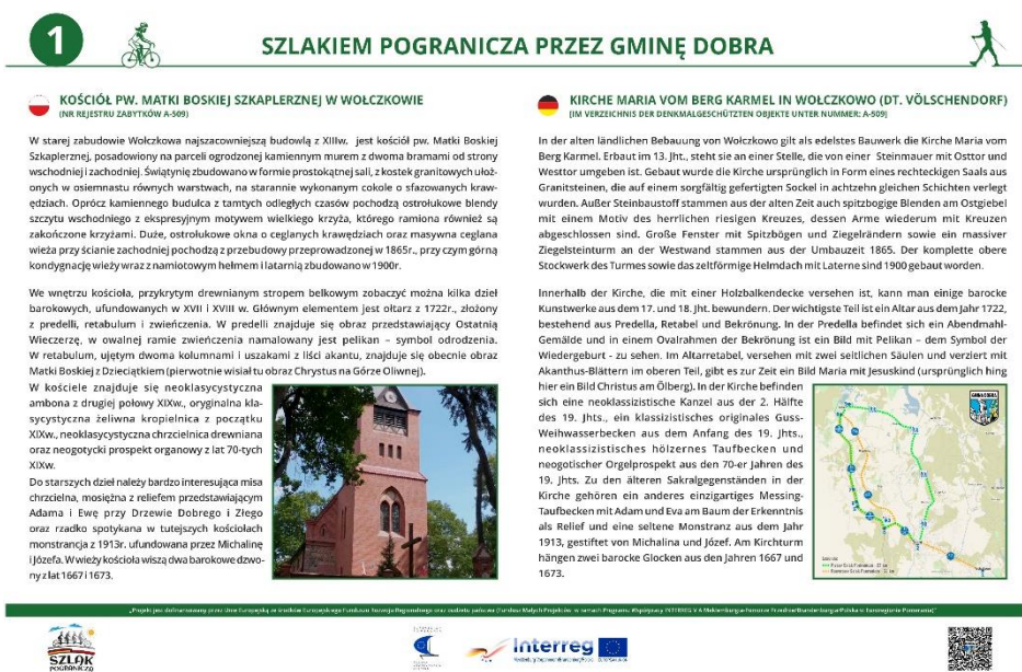
Fot. 2. Tablica Nr 1 - Kościół Wolczkowo