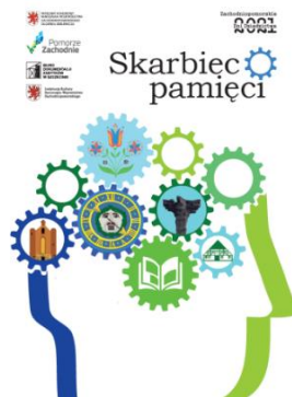
Ryc.2. Logo Zachodniopomorskich Dni Dziedzictwa pod hasłem „Skarbiec pamięci” 2021

Przyjęta w 2019r. Gminna Ewidencja Zabytków Gminy Dobra pozwala na monitorowanie prac podejmowanych przy obiektach zabytkowych znajdujących się na terenie Gminy Dobra. Prace remontowe i budowlane przy obiektach wpisanych do GEZ są zgłaszane do zaopiniowania przez Zachodniopomorskiego Konserwatora Zabytków, a właściciele obiektów zabytkowych są informowani, że zachowanie zabytku we właściwym stanie technicznym, estetycznym i funkcjonalnym leży w interesie społecznym, a wszelkie zmiany i ingerencje w istniejącą architekturę obiektu, mające wpływ na jego wygląd zewnętrzny (bryłę, kompozycję i detal architektoniczny elewacji) nie powinny mieć negatywnego wpływu na wartości, które podlegają ochronie. W 2021r. do Wójta Gminy Dobra wpłynął jeden wniosek o wydanie opinii w sprawie wymiany pokrycia dachowego i stolarki okiennej w budynku mieszkalnym położonym w Wołczkowie i wpisanym do GEZ.