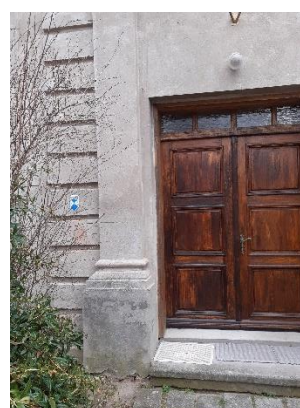
Fot. 3 - 5. Akcja oznakowania zabytków wpisanych do rejestru zabytków znakiem Błękitna Tarcza