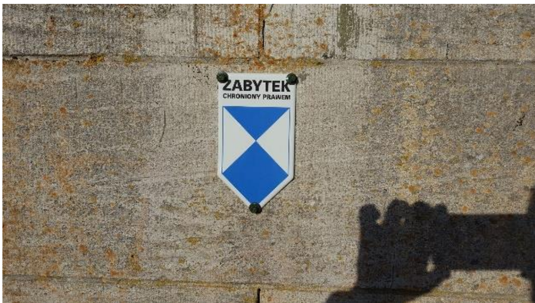
Fot. 6. Znak Błękitna Tarcza