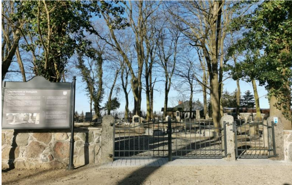
Fot. 1. Lapidarium w Dołujach