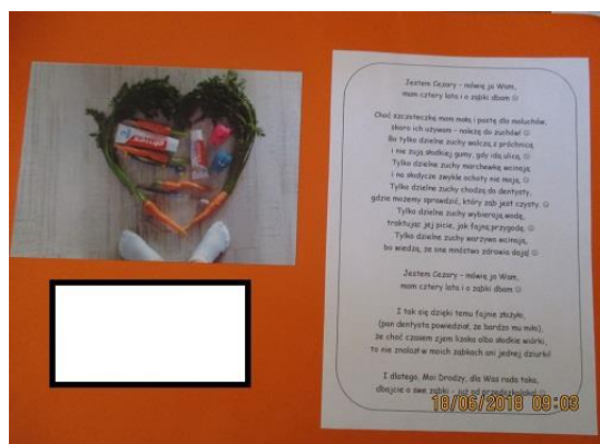
Przedszkolak – Przedszkole Publiczne nr 8 w Policach