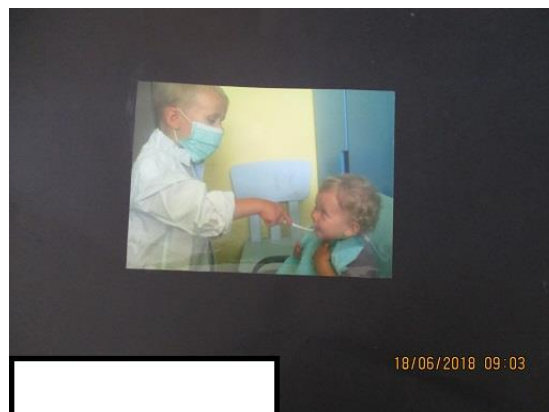
Przedszkolak – Przedszkole Publiczne nr 8 w Policach