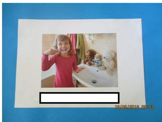
Przedszkolak – Przedszkole Publiczne nr 8 w Policach