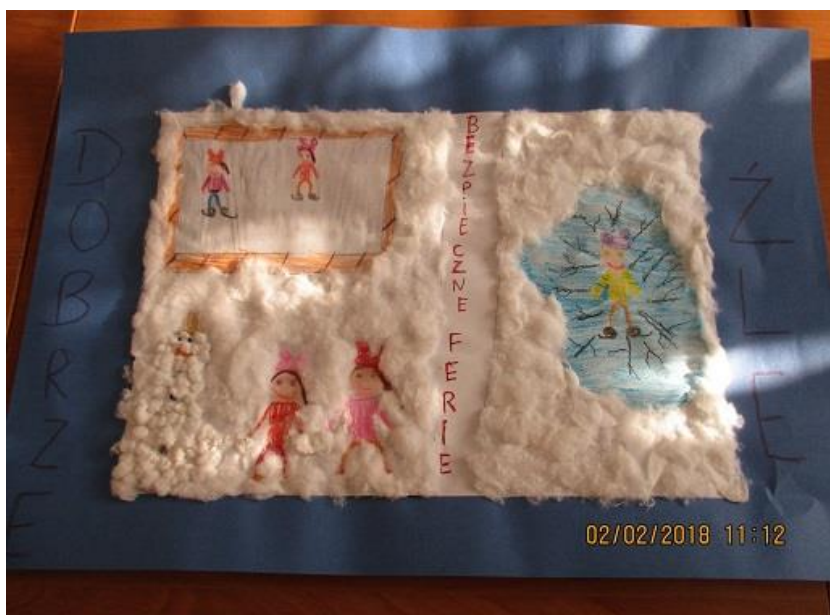
Lena Suślak, klasa I, Szkoła Podstawowa nr 6 z Oddziałami Przedszkolnymi w Policach