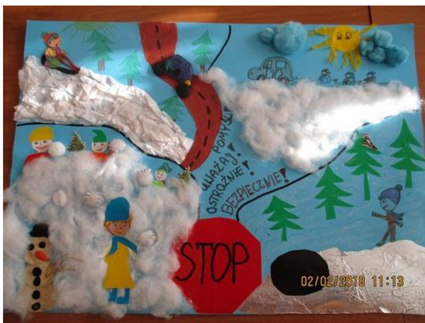
Aleksandra Chrzanowska, klasa II, Szkoła Podstawowa nr 2 w Policach