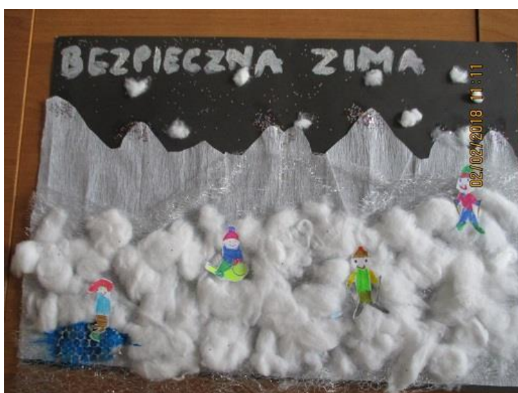
Filip Węglarek, klasa III, Publiczna Szkoła Podstawowa w Dołujach