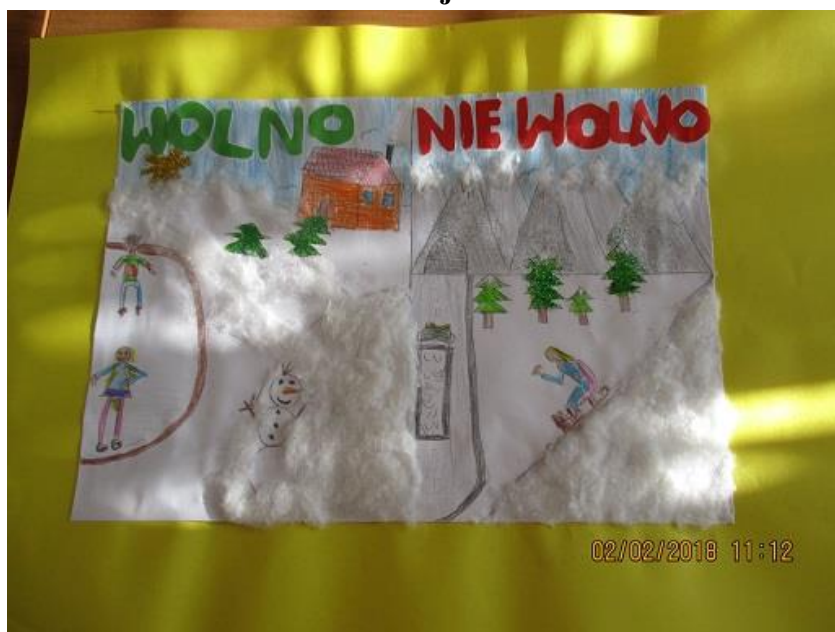
Julia Jońca, klasa I, Szkoła Podstawowa nr 6 z Oddziałami Przedszkolnymi w Policach