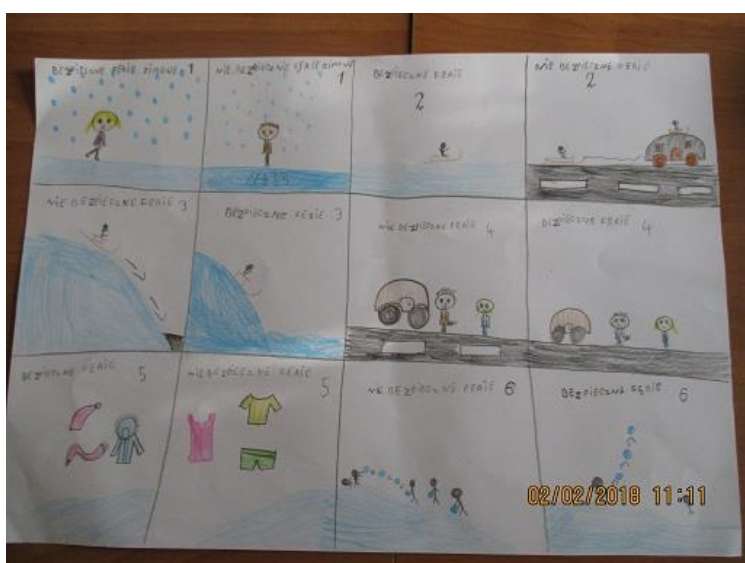
Tamara Wieczorek, klasa I, Szkoła Podstawowa w Przeclawiu