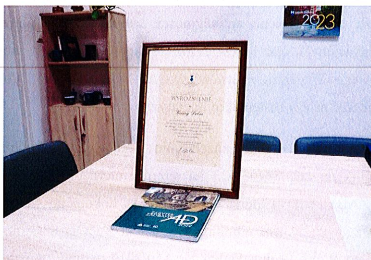
Fot. 5. Wyróżnienie dla Lapidarium w Dołujach w konkursie Zabytek Zadbane 2022.

w kategorii rewaloryzacja przestrzeni kulturowej i krajobrazu za uczytelnienie układu kompozycyjnego, konserwację nagrobków i utworzenie lapidarium na dawnym cmentarzu ewangelickim w Dołujach i wykreowanie symbolicznego łącznika między dawną a współczesną społecznością lokalną. Gmina Dobra otrzymała tablicę „Zabytku Zadbanego” do oznakowania obiektu oraz dyplom. Ponadto Lapidarium w Dołujach podobnie jak pozostałe nagrodzone zabytki będą prezentowane w wydawnictwach Narodowego Instytutu Dziedzictwa przekazywanych właścicielom zabytków i przedstawicielom ogólnopolskiego środowiska konserwatorskiego.