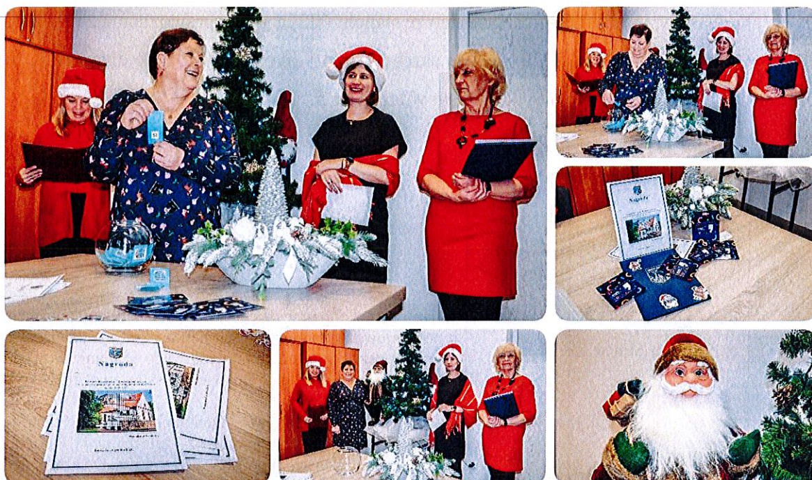
Fot. 7. Losowanie nagród w II edycji Konkursu Krzyżówka.