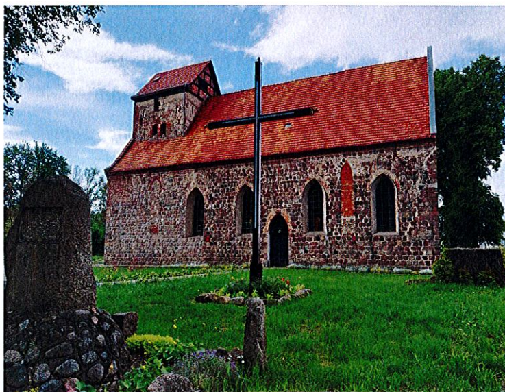
Fot. 3. Kościół p.w. Św. Antoniego Padewskiego w Buku.

W związku z ww Uchwałą Gmina Dobra udzieli w 2024 r. dotacji Parafii Rzymskokatolickiej p.w. Św. Urszuli Ledóchowskiej w Buku w kwocie 3.327.108,80 zł, w tym 3.260.566,62 zł ze środków uzyskanych z Rządowego Programu Odbudowy Zabytków oraz 66.542,18 zł ze środków własnych. Nazwa inwestycji, wg złożonego wniosku o dofinansowanie to ”Renowacja kościoła parafialnego p.w. Św. Urszuli Ledóchowskiej”, a zakres prac obejmuje: renowację elewacji zewnętrznych, renowację wieży dachowej i wymianę poszycia dachowego, wymianę instalacji elektrycznej.