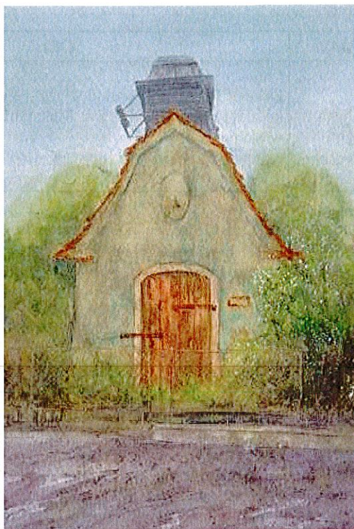
Fot. 1. Remiza- Trafostacja w Stolcu – I miejsce w konkursie plastycznym ZABYTKI GMINY DOBRA w 2023r.

renowacji tego malowniczego i unikatowego na terenie Gminy Dobra obiektu wpisanego do Gminnej Ewidencji Zabytków Gminy Dobra.