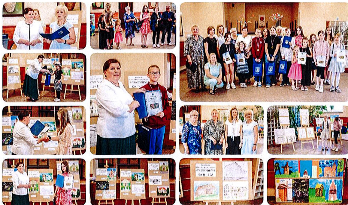
Fot. 6. Gala konkursu plastycznego Zabytki Gminy Dobra w GCKiB w Wolczkowie.