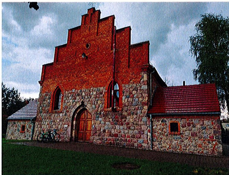
Fot. 4. Kościół p.w. M.B. Królowej Świata w Dobrej.