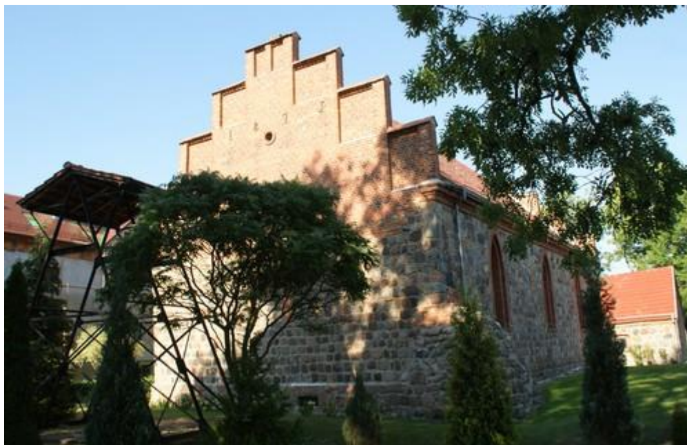
Fot.13. Kościół w Dobrej.

11) Kościół w Dobrej p.w. Matki Boskiej Królowej Świata (nr rej A-497). Kościół wzniesiono w 2 poł. XIII w. z ciosów granitowych, został przebudowany z użyciem cegły w 1879 r. z nadaniem mu form neogotyckich,