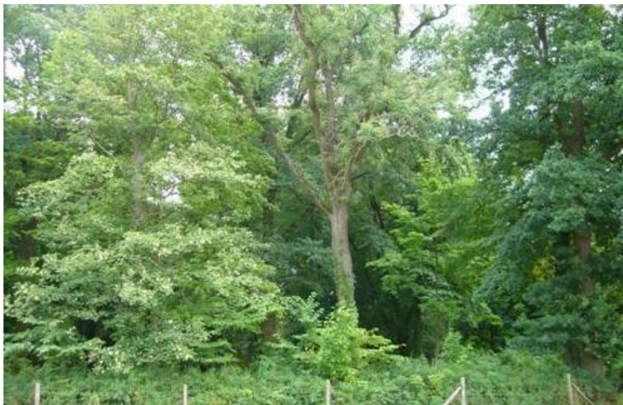
Fot.5. Park dworski w Skarbimierzycach.

5) Park dworski w Skarbimierzycach (nr rej A-531). Obecnie z trudem czytelny, zachowany dawny układ kompozycyjny parku, pochodzącego z końca XVIII w.,