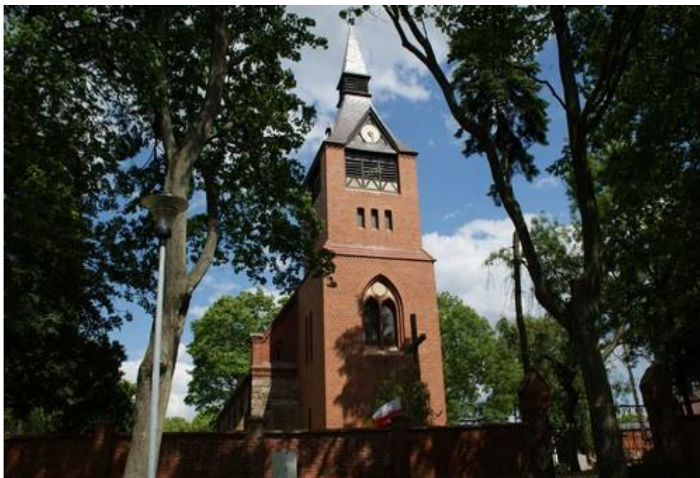
Fot.17. Kościół w Wołczkowie.

15) Kościół w Wołczkowie p. w. Matki Boskiej Szkaplerznej wraz z cmentarzem przykościelnym (nr rej. A-509). Kościół jest murowany z ciosów kamiennych i cegły. Powstał w końcu XIII w., częściowo przebudowany w XVI w.