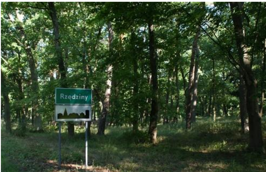
Fot. 4. Park dworski w Rzędzinach.

4) Park dworski w Rzędzinach (nr rej A-532). Obecnie z trudem czytelny, zachowany dawny układ kompozycyjny parku, pochodzącego z końca XVIII w.,