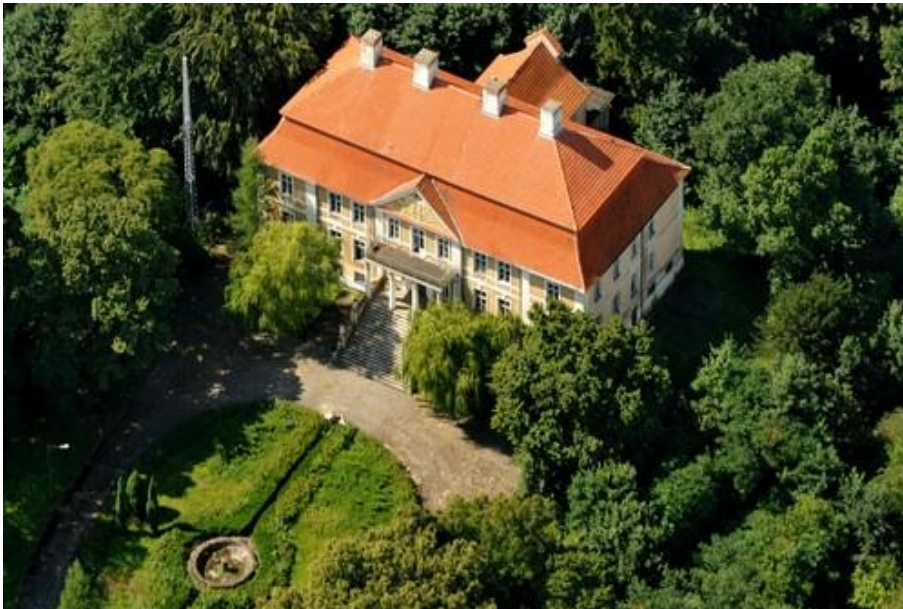
Fot. 8. Pałac w Stolcu.