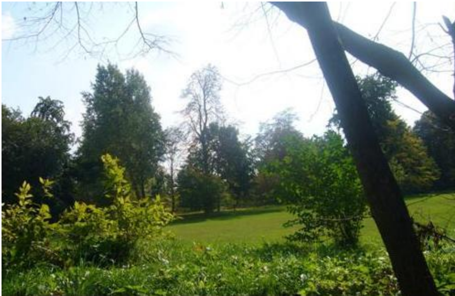
Fot.3. Park pałacowy w Kościecinie.

3) Park pałacowy w Kościecinie (nr rej A-577). Obecnie słabo czytelny dawny układ kompozycyjny parku, pochodzącego z 2 poł. XVIII w.,