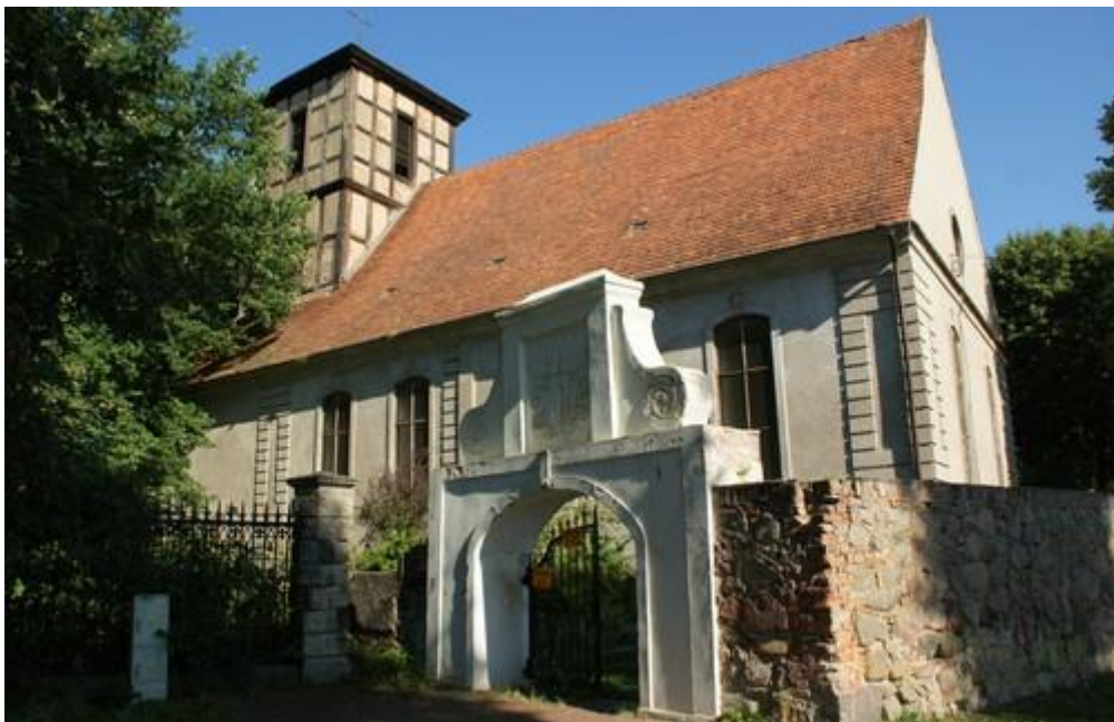
Fot.10. Kościół w Stolcu.