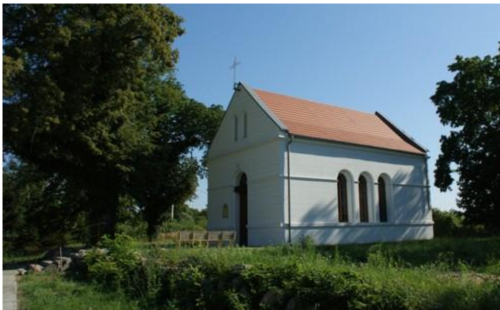
Fot.16. Kaplica w Kościnie.

14) Kościół filialny p.w. MB Fatimskiej (odbudowany) wraz z terenem cmentarza przykościelnego i kamiennym murem ogrodzeniowym położony w miejscowości Kościno (rej. nr A-1136). Kaplica powstała w pierwszej ćwierci XIX w.