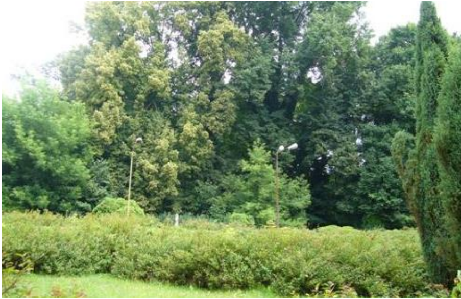
Fot. 7. Park w Stolcu.

7) Pałac i park w Stolcu (nr rej. A-536). Pałac zbudowany został w stylu klasycyzującego baroku. Budowa pałacu rozpoczęta została przez Jürgena Bernharda von Ramin w 1721r. i zakończona w 1727 r. Powstało założenie w typie „entrecour et jardin” wraz z parkiem założonym w stylu francuskim.