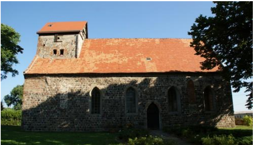
Fot.12. Kościół w Buku.

10) Kościół w Buku p.w. św. Antoniego wraz z cmentarzem (nr rej A-498). Zbudowany został z ciosów granitowych w 2 poł. XIII w., przebudowywany z użyciem cegły w XVI w. i ponownie w 1869 r.,