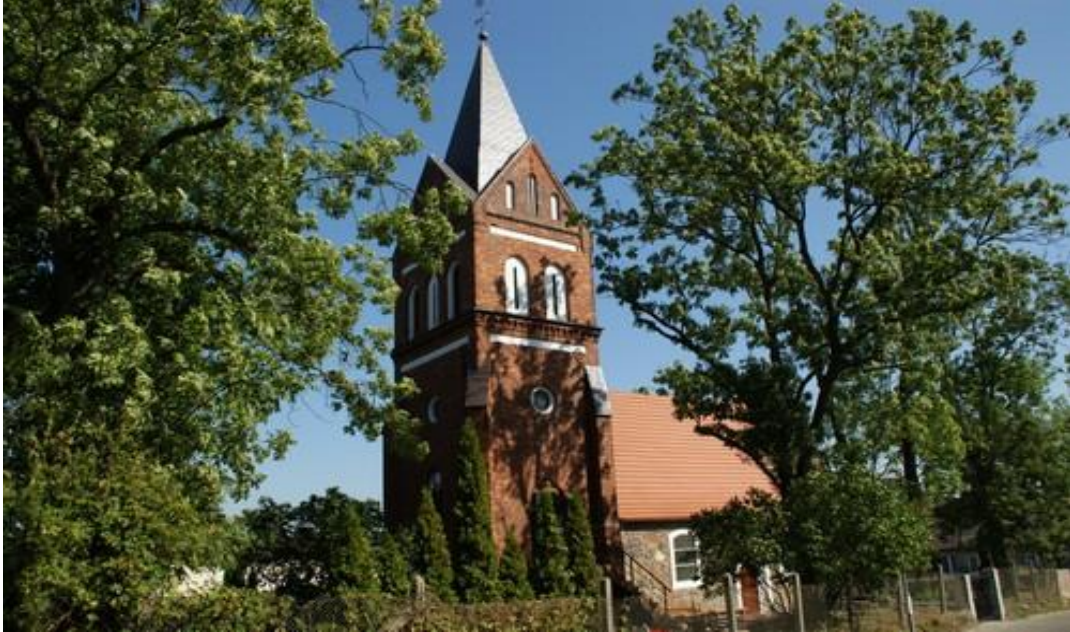
Fot.11. Kościół w Bezzeczu.

9) Kościół w Bezzeczu p.w. Matki Boskiej Różańcowej wraz z cmentarzem przykościelnym (nr rej. A-503). Kościół jest murowany z kamienia polnego w XV w., został przebudowany w 2 poł. XIX w., otrzymał wówczas ceglana neogotycką wieżę. Na terenie cmentarza ochroną prawną objęto też fragment kamiennego muru cmentarnego.