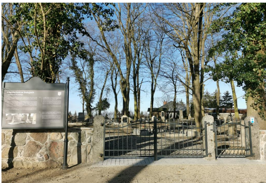
Fot.6. Lapidarium w Dołujach.

6) Lapidarium w Dołujach powstałe na terenie dawnego cmentarza ewangelickiego z połowy XIX w. położonego przy ul. Daniela w miejscowości Dołuje na działce nr 164 (nr rej. A-1566). Cmentarz został zamknięty Uchwałą Nr XL/527/2023 Rady Gminy Dobra z dnia 9 lutego 2023r. w sprawie zamknięcia cmentarza na terenie Gminy Dobra.