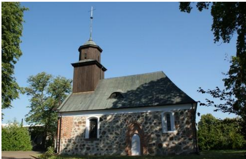
Fot.15. Kościół w Wąwelnicy.

13) Kościół p.w. Matki Boskiej Częstochowskiej w Wąwelnicy (nr rej. A-508). Jest murowany z kamienia polnego, powstał w 2 poł. XIII w., został rozbudowany w XV w., a następnie przebudowany w XVIII w.