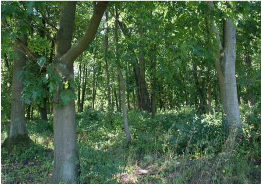
Fot. 1. Park pałacowy w Bezzreczu.

1) Park pałacowy w Bezzreczu (nr rej A-864). Obecnie z trudem czytelny, zachowany dawny układ kompozycyjny parku, pochodzącego z końca XVIII w.,