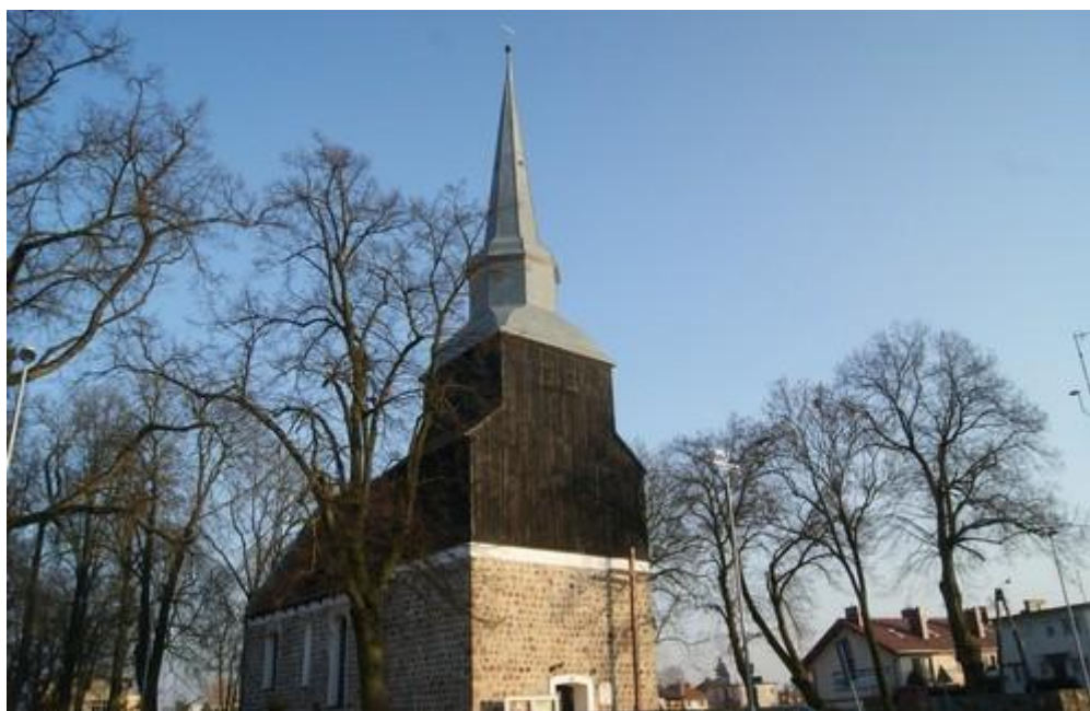
Fot.14. Kościół w Mierzynie.

12) Kościół w Mierzynie p.w. Matki Boskiej Bolesnej wraz z cmentarzem przykościelnym (nr rej A-477). Jest murowany z ciosów granitowych. Powstał w 2 poł. XIII w., po pożarze wieży w 1637 r., odbudowany w 1644 r.